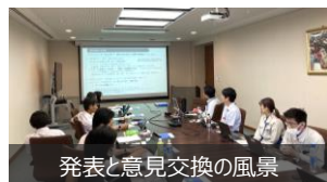
発表と意見交換の風景