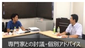
専門家との討議・個別アドバイス